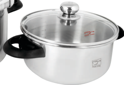
٤ لیتر |