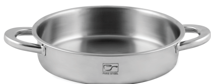
۲۴∅ | ۲,۴ لیتر | ۲۴*۶ سانتیمتر