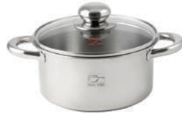
۱۸∅ | ۲,۳ لیتر | ۱۸*۹ سانتیمتر