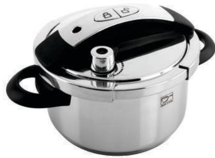
٤ لیتر |