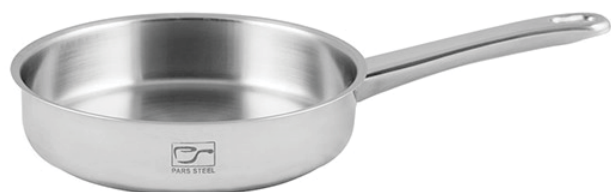
۲۴∅ | ۲,۴ لیتر | ۲۴*۶ سانتیمتر