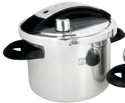
٦ لیتر |