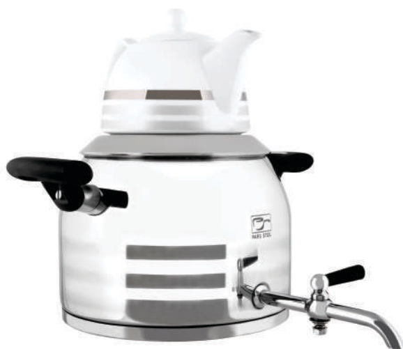
مدل درسا ۵ لیتر