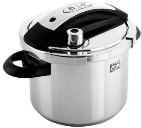
٦ لیتر |