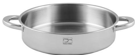
۲۸∅ | ۳,۶ لیتر | ۲۸*۷ سانتیمتر