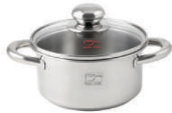
۱۶∅ | ۱,۶ لیتر | ۱۶*۸ سانتیمتر