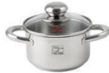
۱۴∅ | ۱,۴ لیتر | ۱۴*۷ سانتیمتر