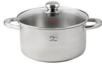
۲۴∅ | ۵,۶ لیتر | ۲۴*۱۲ سانتیمتر