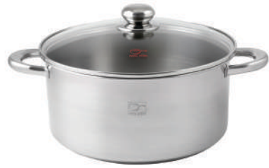
۲۸∅ | ۸,۵ لیتر | ۲۸*۱۴ سانتیمتر