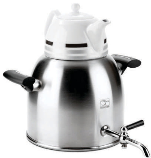
مدل پارس ۵,۷ لیتر