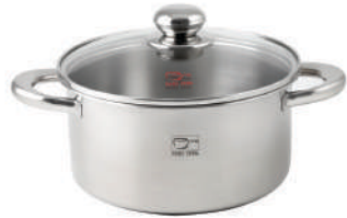
۲۲∅ | ۴,۲ لیتر | ۲۲*۱۱ سانتیمتر