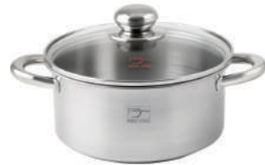
۲۰∅ | ۳,۳ لیتر | ۲۰*۱۰ سانتیمتر